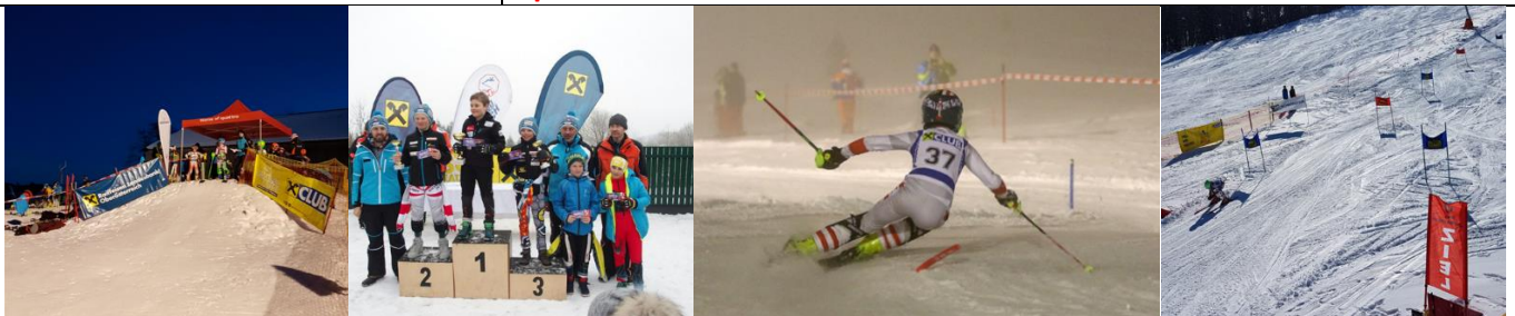
Besonders Fotos mit den Sponsoren sind wichtig!

www.skizeit.net ... einloggen auf Verwaltung ... Meine Skizeit Button Fotoapparat (Fotos veröffentlichen) Rennen aufrufen über „bearbeiten“ Veröffentlichen Fotos NEU ... Fotos (auch mehrere gleichzeitig) aufrufen Speichern